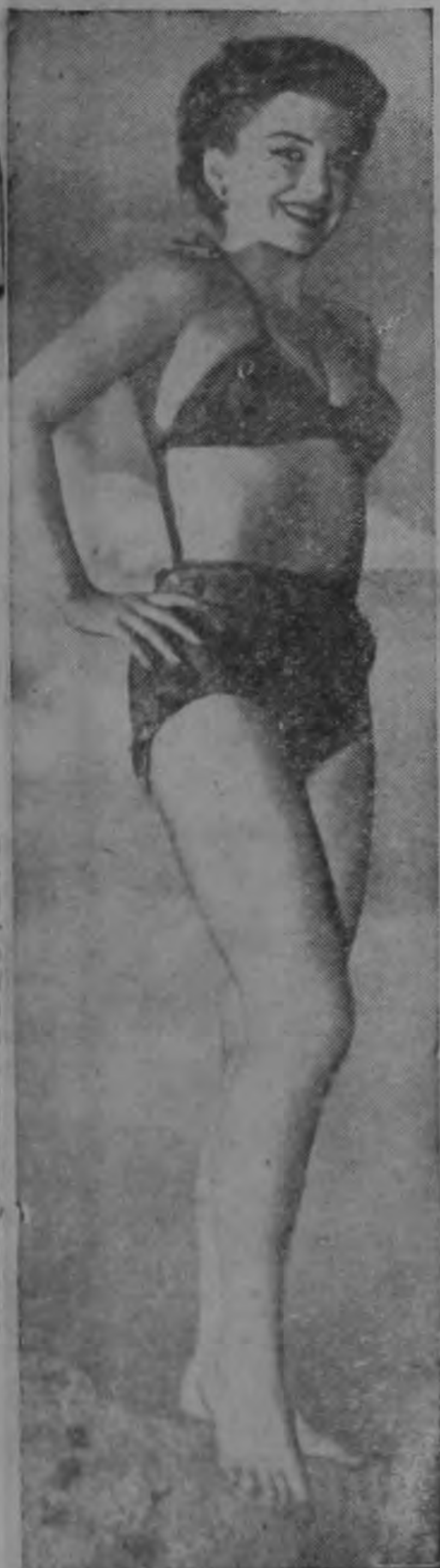
La belleza que reproduce esta foto es nada menos que Anne Baxter, la artista de Hollywood, que aquí decide mostrarnos algunos de sus encantos.

Se ha considerado, también, que los colegios deben prestar esa colaboración sin que, por ello, interrumpan o perjudiquen el curso normal del desarrollo de su trabajo regular, pues es preocupación máxima de dicho Departamento de que los programas y demás actividades colegiales se realicen en la forma más amplia y continuada que se pueda.