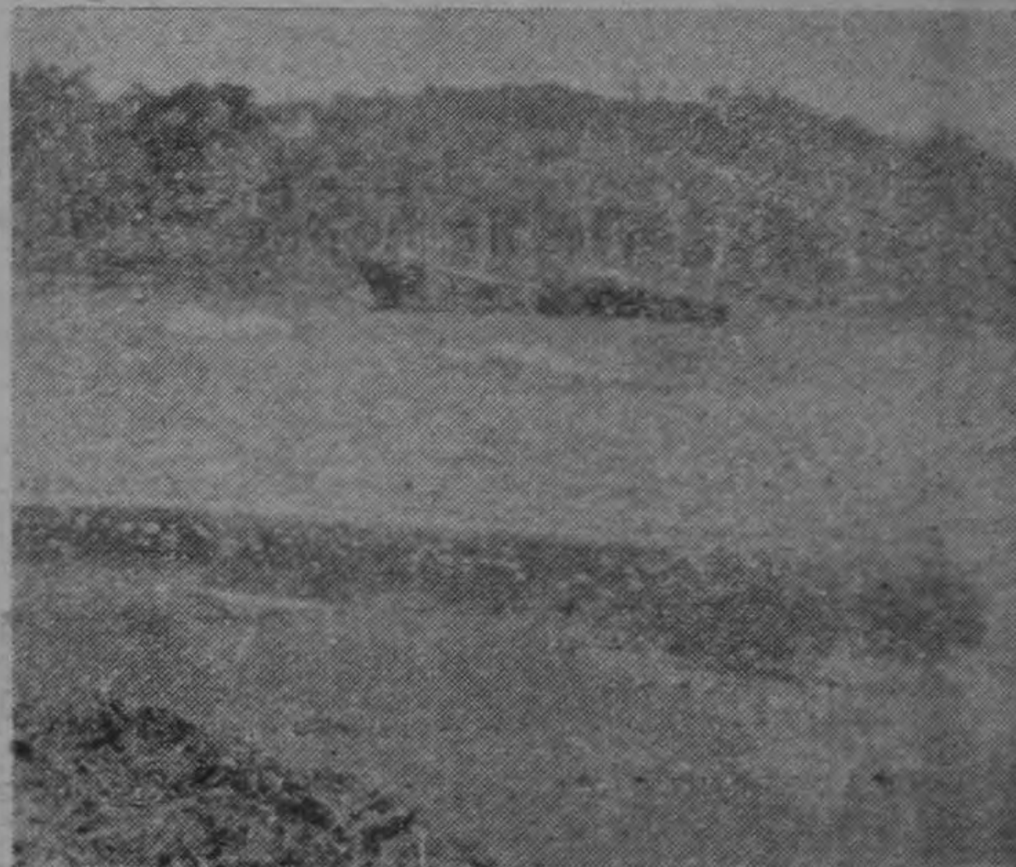
La lancha "Mary Jane", propiedad de la Atlantic Industrial Company, se hundió el martes 20 en Tortuguero, y quedó en este estado.